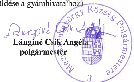
Lánginé Csik Angéla polgármester